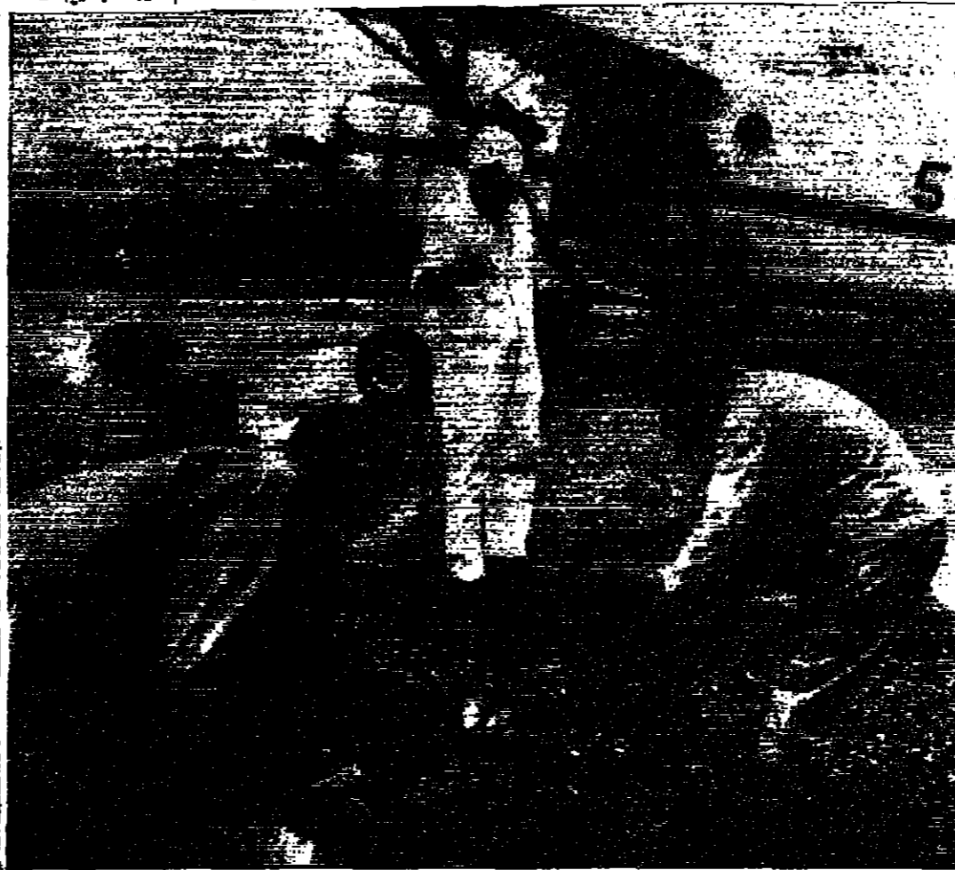
طائرة حملة بالمواد القتلة للجراد وهي على أرض المطار في أسره قبل توجيهها إلى المكان التي ستقوم برشها لإزالة الجراد